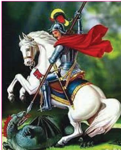
Inserted by: Firm Believer, Houston