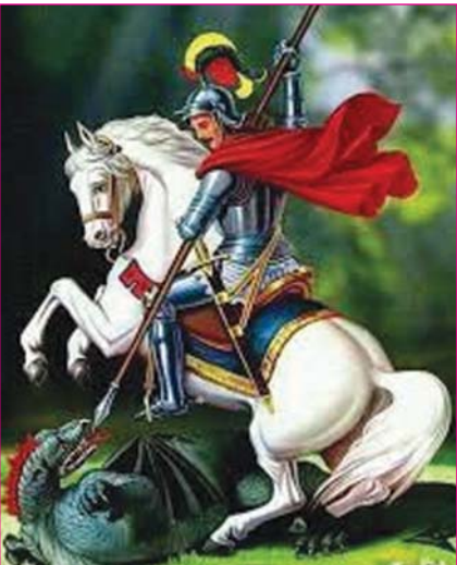
Inserted by: Firm Believer, Houston