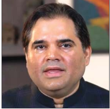
വരുൺ പറഞ്ഞതായി പാർട്ടി വൃത്തങ്ങൾ പറഞ്ഞു.

യ്ക്കെതിരും കൂടുംബാംഗത്തിനെതിരെ മത്സരിക്കുന്ന തരത്തിലുള്ള സർക്കുസായി രാഷ്ട്രീയത്തെ കാണുന്നില്ലെന്ന് വരുൺ പറഞ്ഞതായി പാർട്ടി വൃത്തങ്ങൾ പറഞ്ഞു.