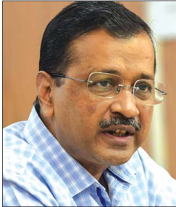
ത്തിൽ പ്രതികരിക്കാൻ നിർബന്ധിതരാവുകയാണെന്ന് കോടതി പറഞ്ഞു. പാഠപുസ്തകവിതരണം കോടതി

ന്യൂഡൽഹി: മദ്യനയക്കേസിൽ അറസ്റ്റിലായി തിഹാർ ജയിലിൽ കഴിയുന്ന മുഖ്യമന്ത്രി അരവിന്ദ് കെജ്‌റിവാൾ അധികാരത്തിനു പിന്നാലെയാണെന്ന് ഡൽഹി ഹൈക്കോടതി.