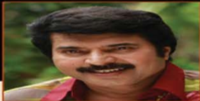
Mammooty Chairman, Kairali TV

ഒരു ജനതയുടെ ആത്മാവിഷ്കാരം എന്നും ജനങ്ങളോടൊപ്പം